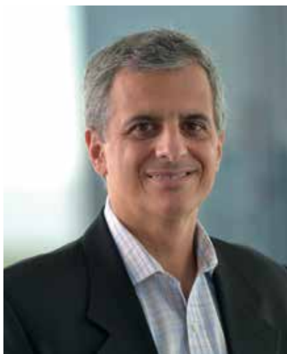
Néstor García. Radiografía de la presencia femenina.

Este informe de las mujeres que integran los directorios de las 500 empresas con mayores ingresos del país es un aporte trascendente porque nos permite saber la representati-